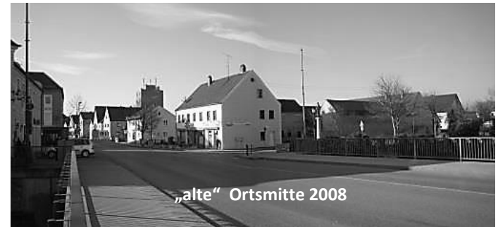
„alte“ Ortsmitte 2008

für die Neugestaltung der Ortsmitte aufgrund Antrag, überzeugender Konzeptvorstellung und mehrfacher Gespräche bei der Regierung von Oberbayern